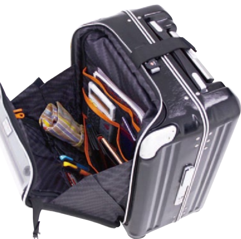
前ポケット解放時▶

※シート仕様は単独使用時によるものです。諸条件により変わりますので、あらかじめご了承ください。